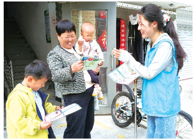
4月16日,周口师范学院计算机科学与技术学院的学生党员志愿者走进书香门第小区,开展垃圾分类宣传。近年来,该院坚持以党员教育为引领,充分发挥学生党员先锋模范作用与党支部战斗堡垒作用,推动志愿服务常态化开展。

文脉悠长,同心共融。太昊伏羲陵文化旅游区依托伏羲文化纽带,持续促进各民族交往交流交融,让中华民族共同体意识根植人心,不断谱写文旅融合赋能民族团结进步的新篇章。②25